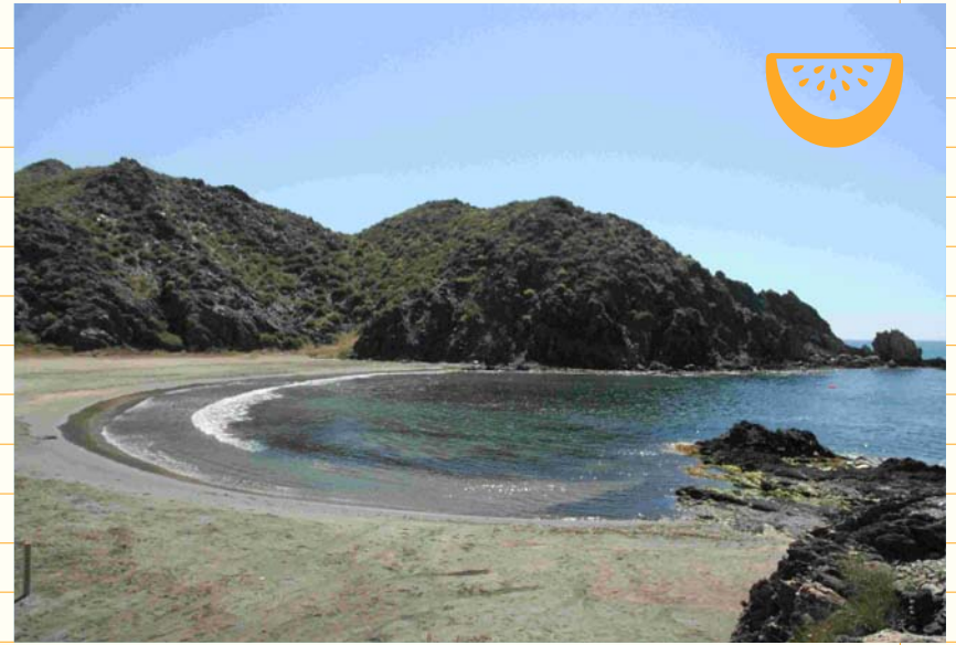
Playa del Siscal Litoral de Lorca