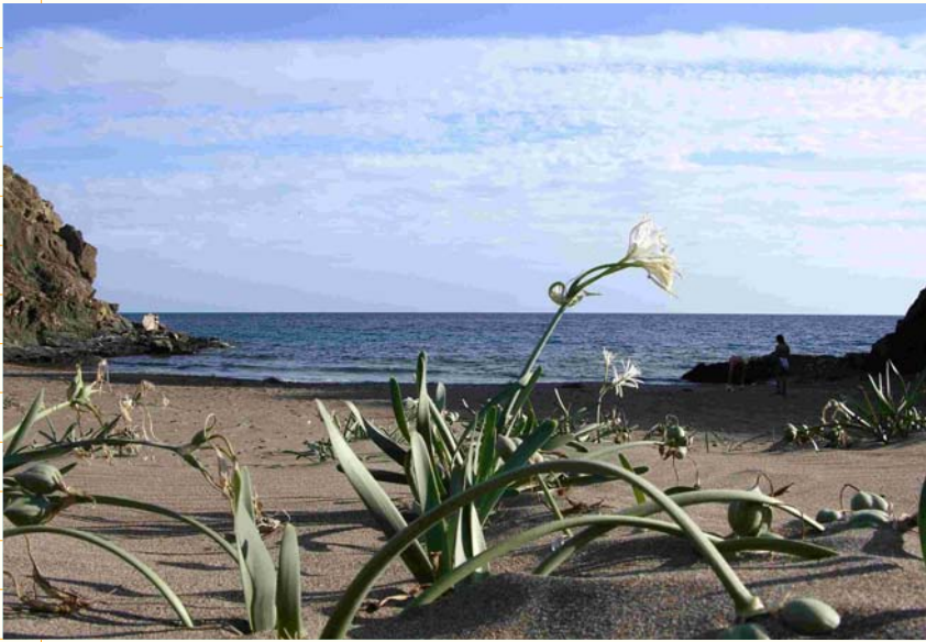
Playa del Baño de Las Mujeres Litoral de Lorca