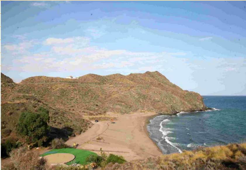
Playa de Calnegre Litoral de Lorca