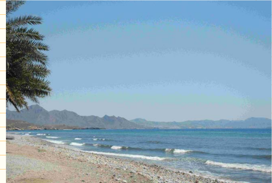
Playa de Puntas de Calnegre Litoral de Lorca