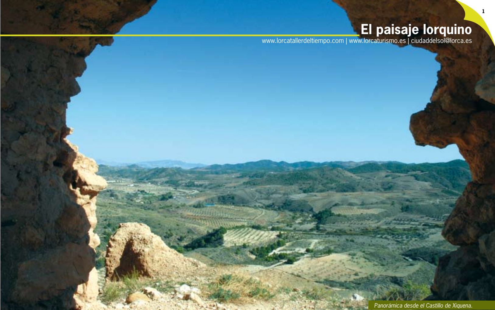
Panorámica desde el Castillo de Xiquena.

Lorca es una bella ciudad monumental situada en el sudeste peninsular y en el área sur occidental de la Región de Murcia. Su gran extensión, más de 1.600 km 2 , hace que pueda mantener límites con municipios de tierras Andaluzas y de la Región de Murcia (Puerto Lumbreras, Águilas, Mazarrón, Totana, Aledo, Mula, Caravaca de la Cruz y Cehegín). Este hecho hace que podamos afirmar que Lorca cuenta con una extraordinaria diversidad de atractivos que nos llevan desde el mar hasta las elevadas cimas de sus tierras altas atravesando su extensa huerta donde se encuentra el centro urbano que fue declarado Conjunto Histórico-Artístico en 1964.