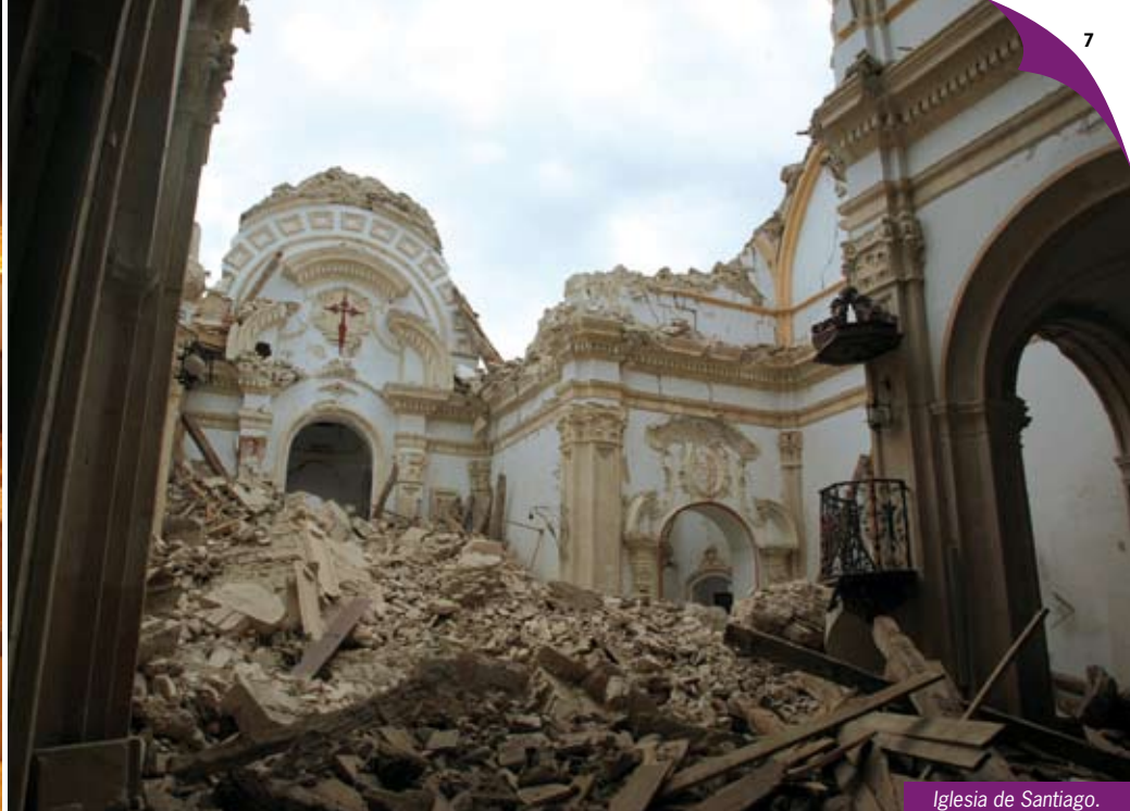
Iglesia de Santiago.

PLAZA DE ESPAÑA , su configuración urbana data del siglo XVI, aunque fue en el siglo XVIII cuando alcanzó su esplendor como centro neurálgico de la ciudad. En torno a ella se ubicaron los edificios del Concejo, del Cabildo Colegial y del Corregimiento, además de otros destinados a servicios, ya existentes o construidos pocos años más tarde, como los dos positos, la cárcel y el mercado configurando, en definitiva, un centro de poder. Esta plaza fue escenario de espectáculos, ferias, mercados, ejecuciones, corridas de toros, conciertos, representaciones teatrales, etc, convirtiéndose así en el centro de la vida social de los habitantes de la ciudad.