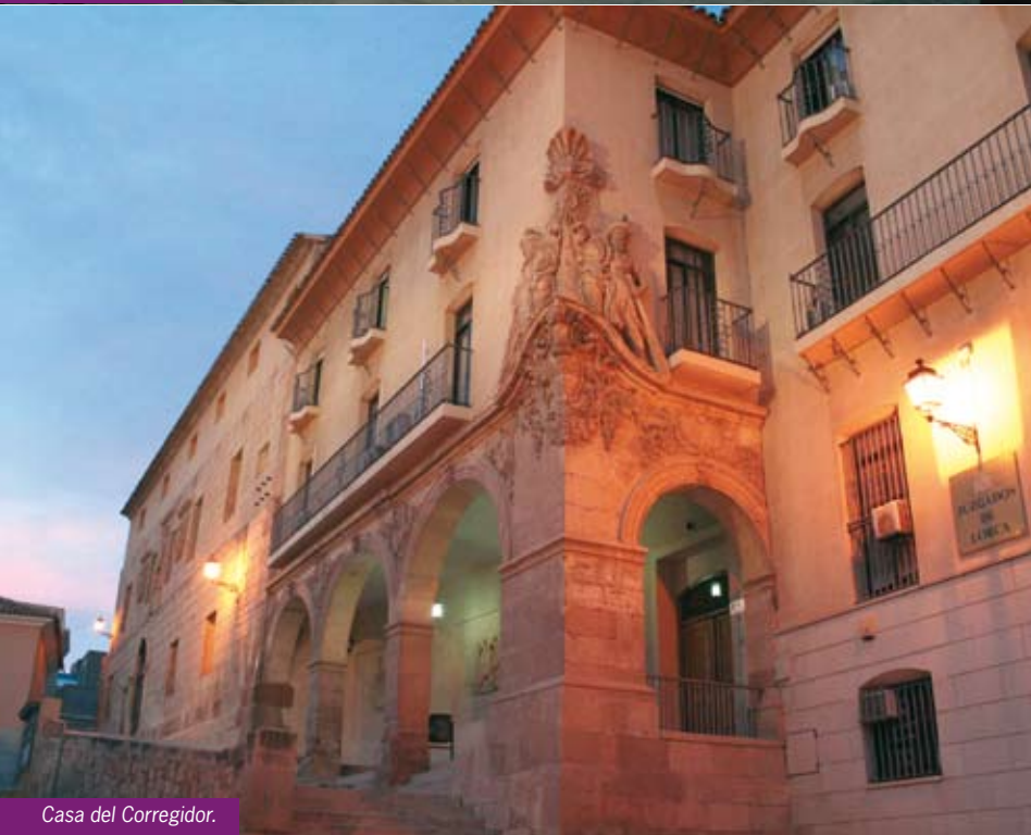
Casa del Corregidor.