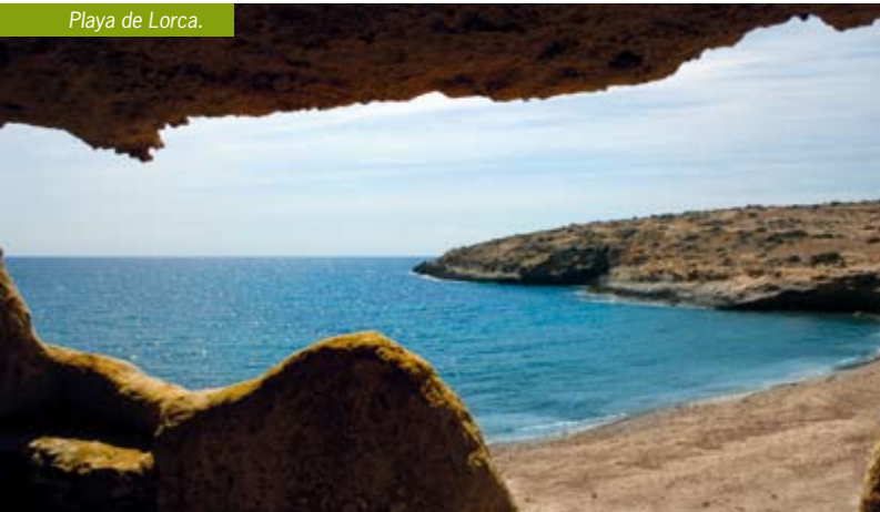
Playa de Lorca.