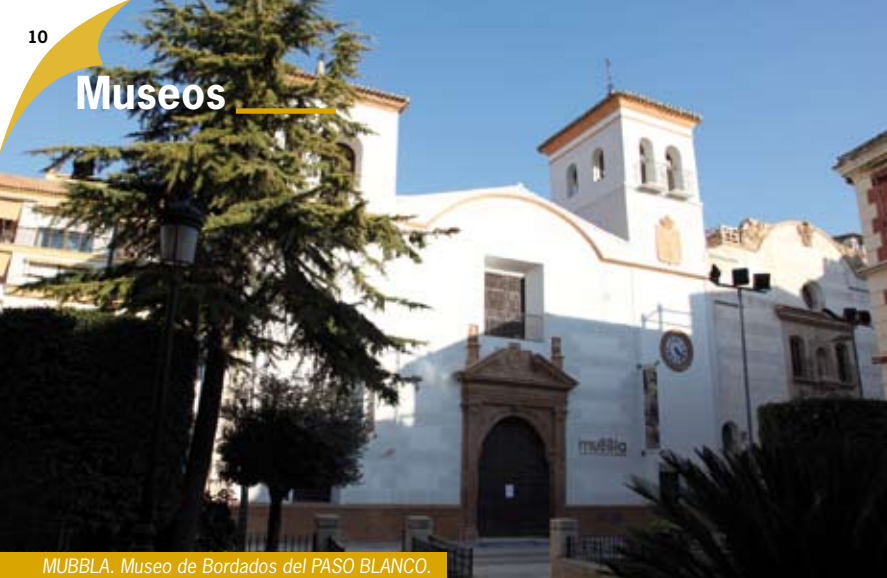
MUBBLA. Museo de Bordados del PASO BLANCO.