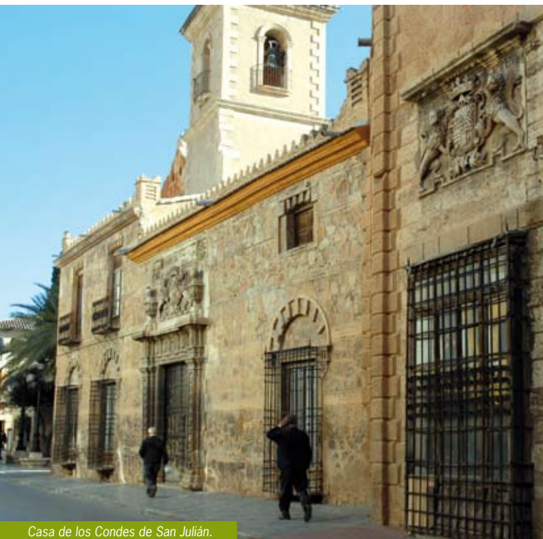
Casa de los Condes de San Julián.