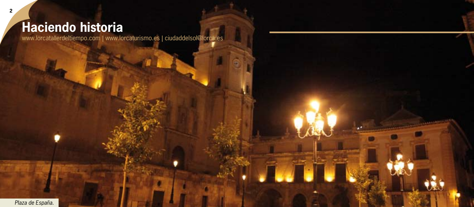
Plaza de España.

www.lorcatallerdeltiempo.com | www.lorcaturismo.es | ciudadelsol@lorca.es