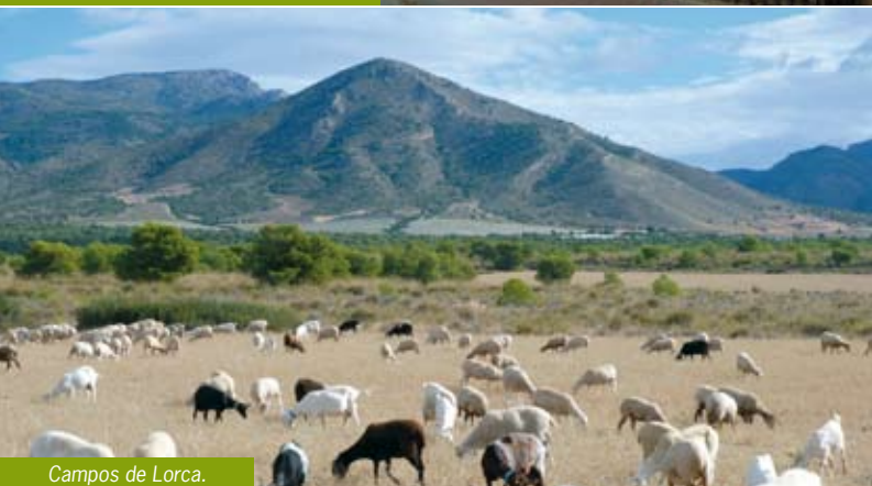
Campos de Lorca.