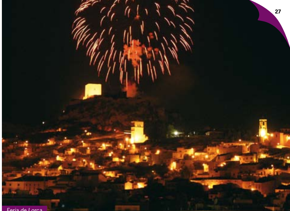
Feria de Lorca.

MUESTRA LOCAL DE FOLKLORE INFANTIL «CARMEN MARTÍNEZ DE MIGUEL» que tiene lugar en junio.