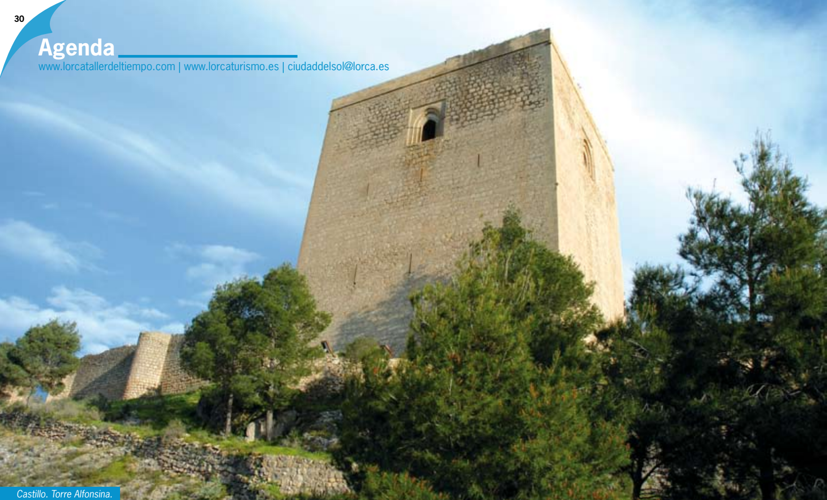
Castillo. Torre Alfonsina.