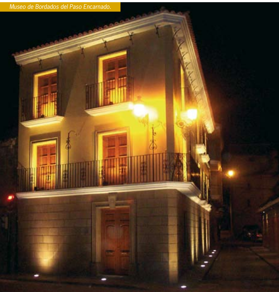
Museo de Bordados del Paso Encarnado.

Los museos de bordados de los Pasos Azul, Blanco, Encarnado y Morado, hacen posible disfrutar de la Semana Santa de Lorca los 365 días del año.