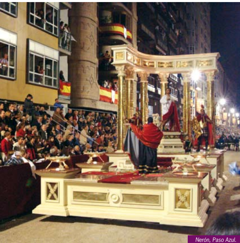
Nerón, Paso Azul.

La Semana Santa lorquina constituye una de las manifestaciones religiosas más importantes y originales de cuantas se celebran en España y en el mundo. La espectacular puesta en escena de los denominados desfiles-bíblicos es única, y desde su origen en 1855, en el que un grupo de 30 personas escenificaron la entrada de Jesús en Jerusalén, su evolución ha sido imparable. Personajes en vivo, a caballo, en carro, carrozas, sacados de otras civilizaciones del antiguo y nuevo testamento: Marco Antonio y Cleopatra, La Reina de Saba y el Rey Salomón, Esther y Asuero, Infanterías Romana y Egipcia, y otros personajes bíblicos, han contribuido a que la Semana Santa de Lorca vaya más de lo puramente convencional. La Semana Santa de Lorca está declarada de Interés Turístico Internacional.