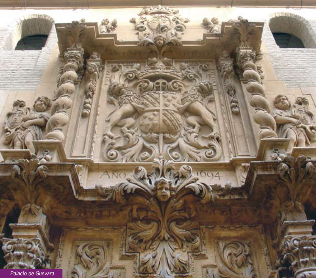
Palacio de Guevara.