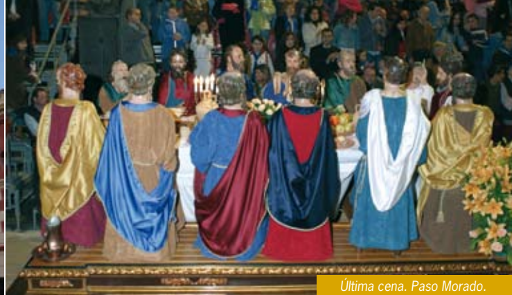
Última cena. Paso Morado.