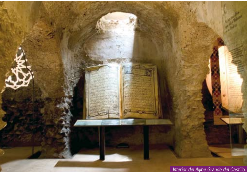
Interior del Aljibe Grande del Castillo.

El centro de visitantes de Lorca, Taller del Tiempo, donde actualmente se localiza la Oficina de Turismo de Lorca, otrora Convento de la Merced, permite al turista un primer contacto con la realidad de la ciudad, de su historia, de su entorno y de sus costumbres a través de sus exposiciones permanentes e interactivas.