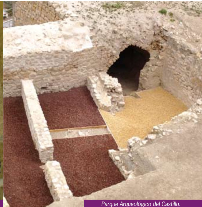
Parque Arqueológico del Castillo.