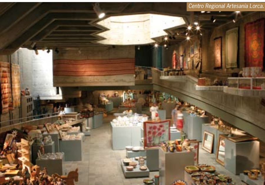
Centro Regional Artesanía Lorca.

Podemos mencionar de forma especial los talleres de bordados, documentados desde el siglo XVI, tanto en lana para el adorno de los "refajos" o falda femenina, como en sedas y oro cuyo esplendor tiene lugar en "Semana Santa". Podemos admirar estos bordados en las "Exposiciones del Patrimonio de las Cofradías" durante estas fechas y también el resto del año en los "Museos y casas de Bordados" de los Pasos Azul, Blanco, Encarnado y Morado.