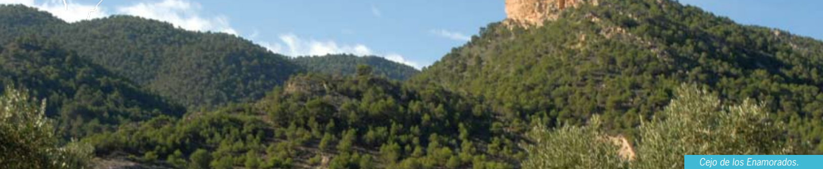
Cejo de los Enamorados.