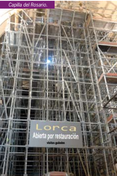
Capilla del Rosario.