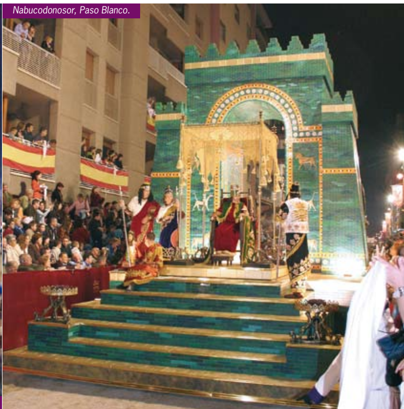
Nabucodonosor, Paso Blanco.