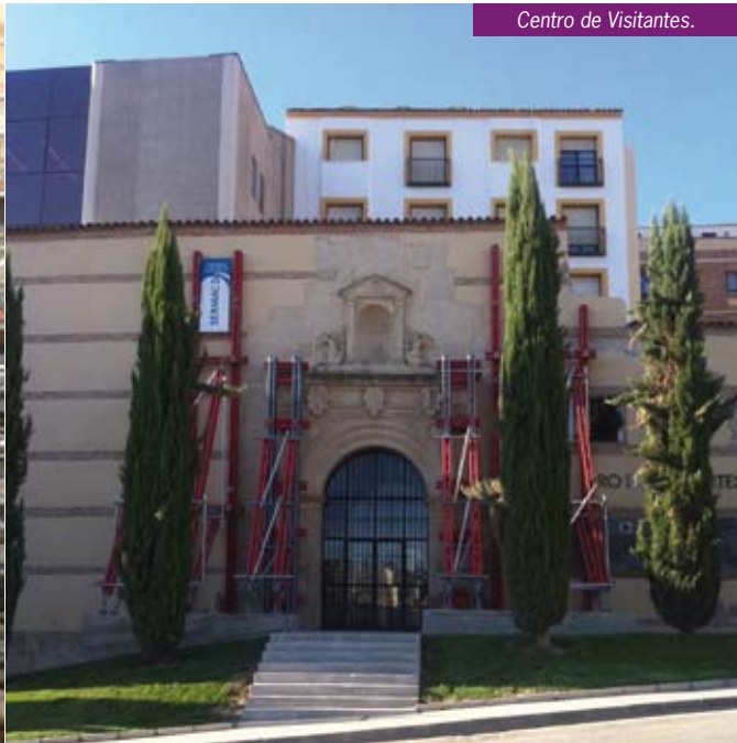
Centro de Visitantes.