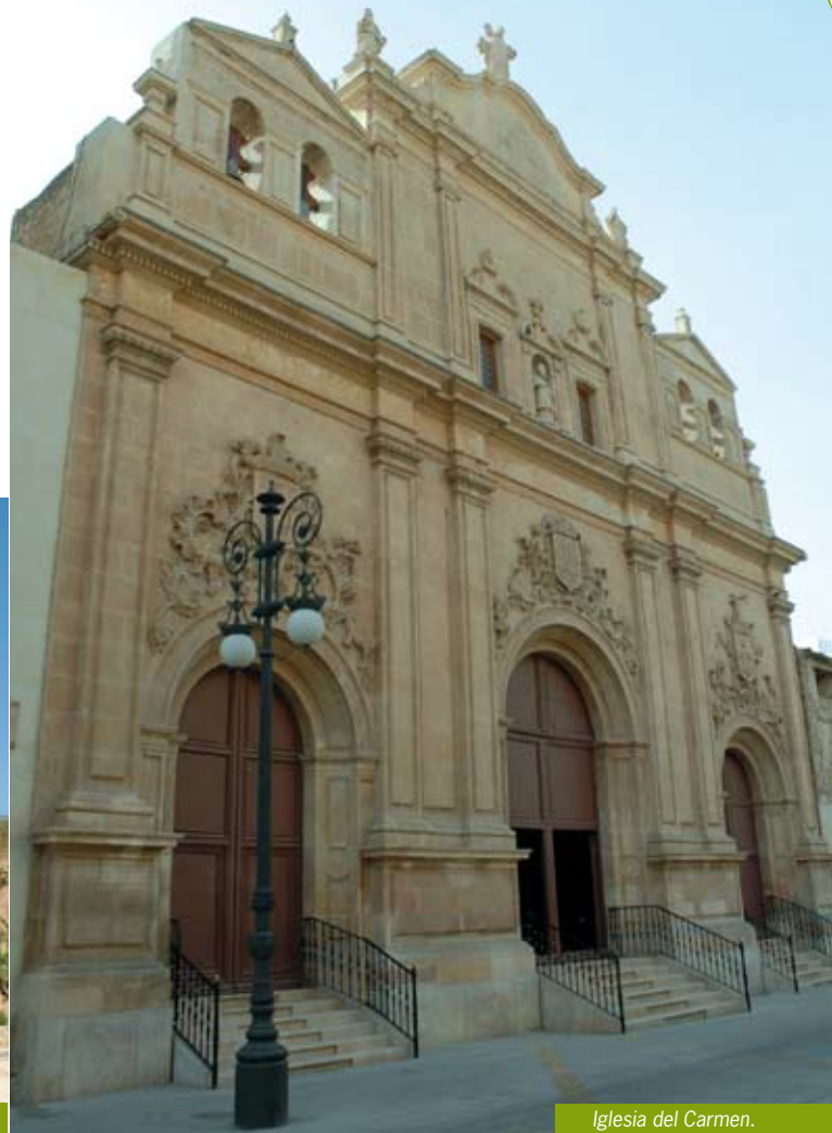
Iglesia del Carmen.