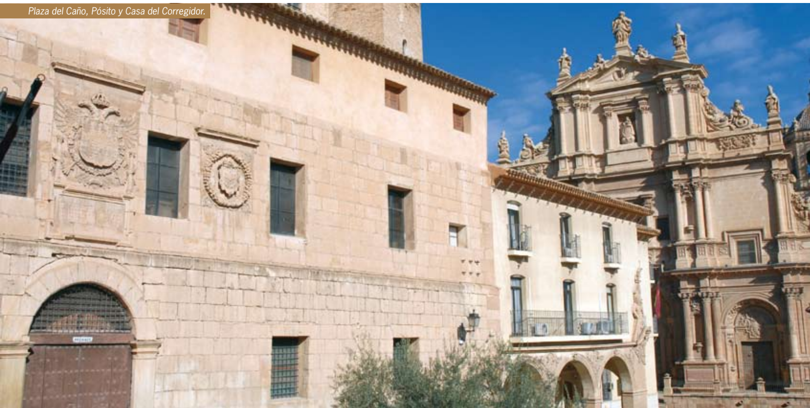
Plaza del Caño, Pósito y Casa del Corregidor.