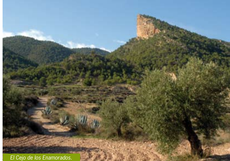
El Cejo de los Enamorados.

ALMENDRICOS. La Paz, 7. - Almendricos - ..... T. 968 440 226