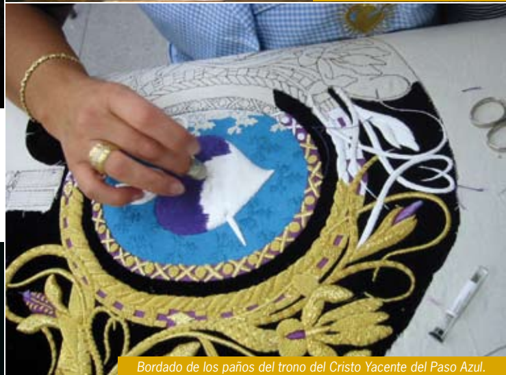
Bordado de los paños del trono del Cristo Yacente del Paso Azul.

La Semana Santa de Lorca, declarada de INTERÉS TURÍSTICO INTERNACIONAL , es, por muy sorprendente que parezca, un Museo Vivo, un estallido de color y de una espectacularidad sin precedentes, donde uno de los mayores exponentes se encuentra en la riqueza de los bordados de túnicas, mantos, palios... realizados en hilo de oro, plata y sedas.