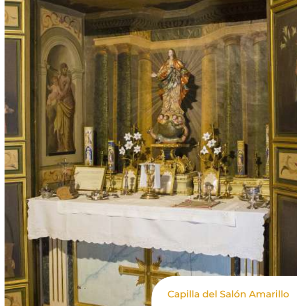
Capilla del Salón Amarillo