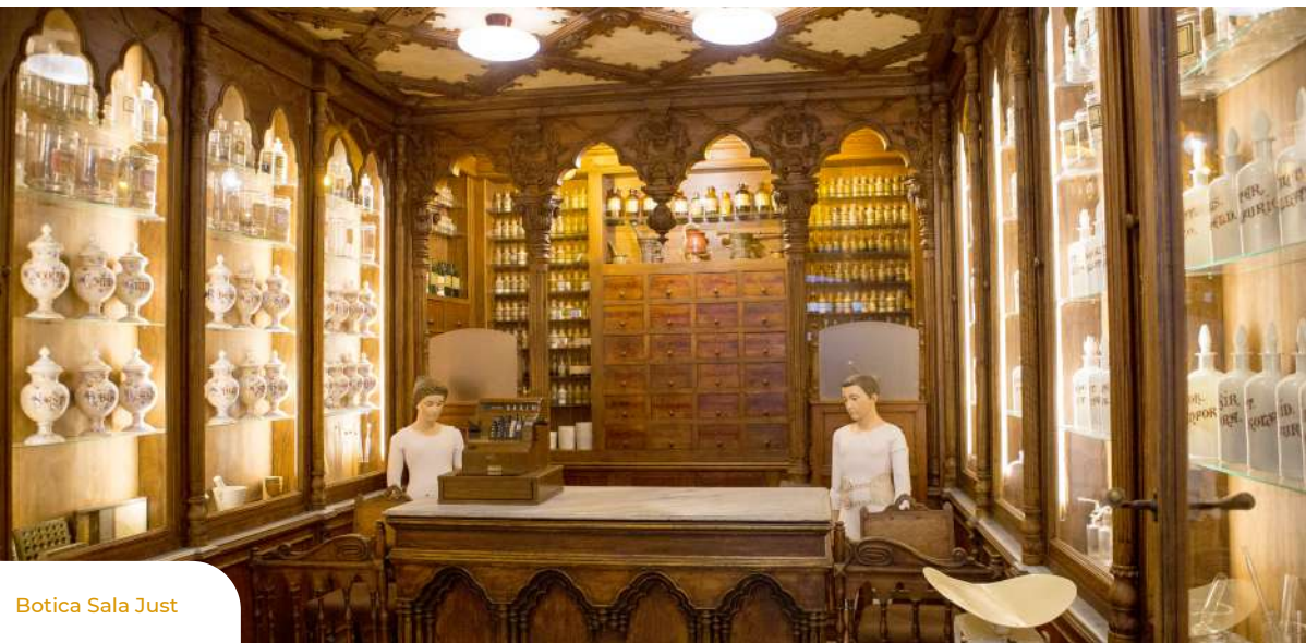
Botica Sala Just